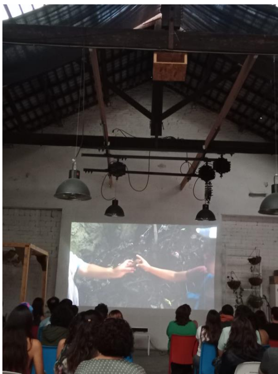
Gran Fiesta Cos Territoris 2024