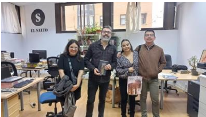
Visita a la redacción del periódico El Salto.