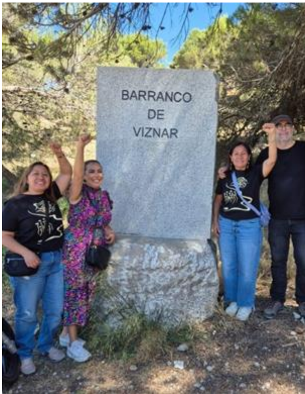
Visita a las Fosas comunes en Viznar, Granada, y charla con el equipo de antropología forense. Intercambio de experiencias en el acompañamiento a familiares de víctimas de desaparición.