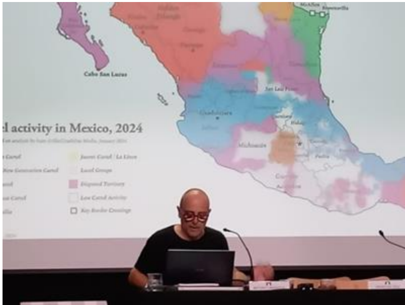
Charla sobre periodismo en la Frontera México EEUU organizada por la Unipau