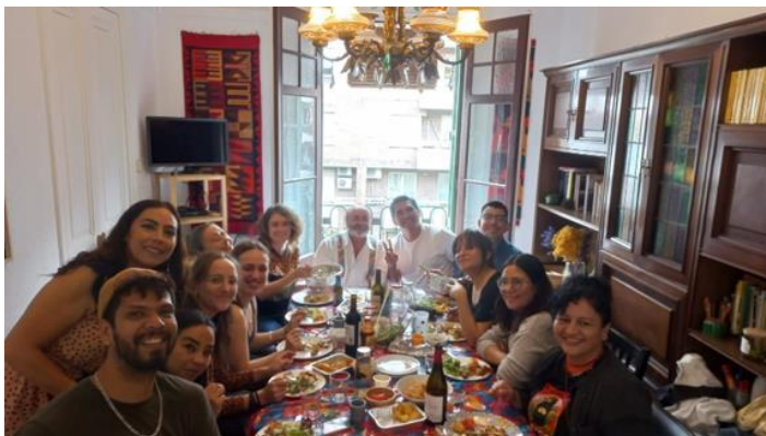
Comida de las periodistas acogidas con el equipo técnico y de acompañamiento del Programa Barcelona Protege a Periodistas de México