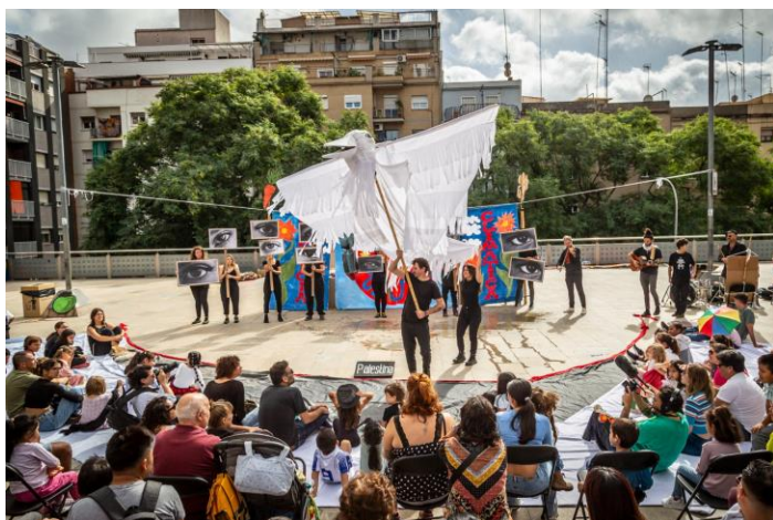
Circo Popular de la Justícia Climàtica