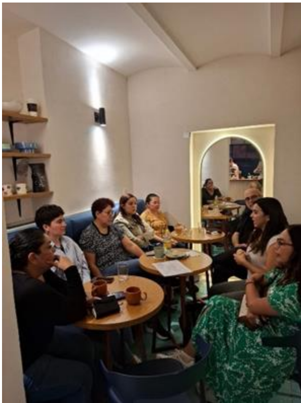
Reunión con mujeres periodistas en León, Guanajuato, para presentar el Programa y las vías de acceso al mismo.