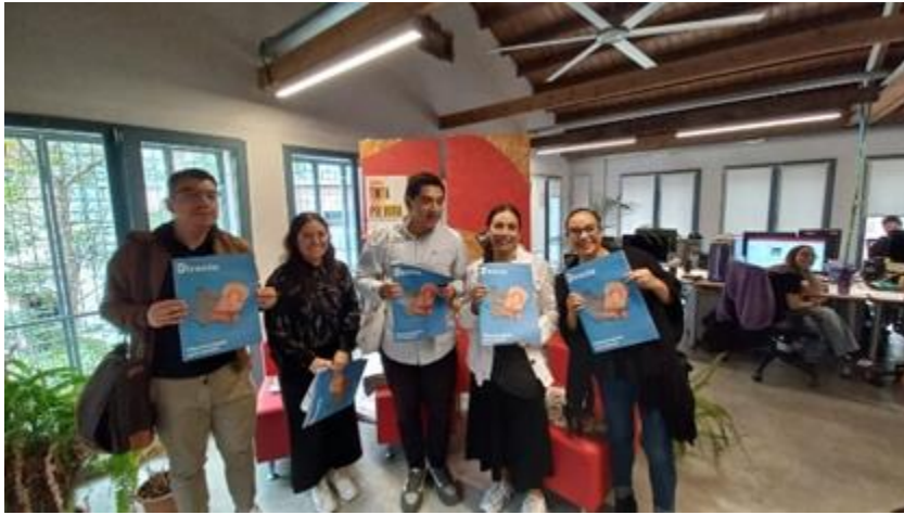
Visita a la redacci3n del peri3dico La Directa