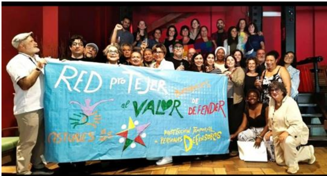
Encuentro de la Red ProTejer de Programas estatales de protección, en Gijón, Asturias