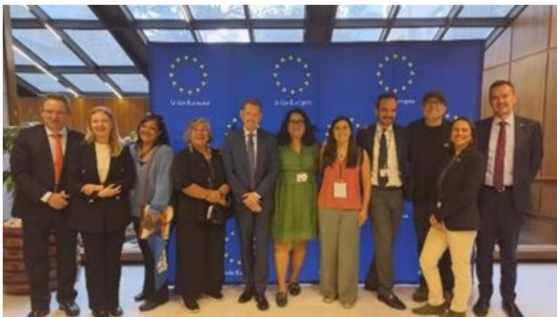
Reunión con embajadores y representantes de la delegación de la UE en México