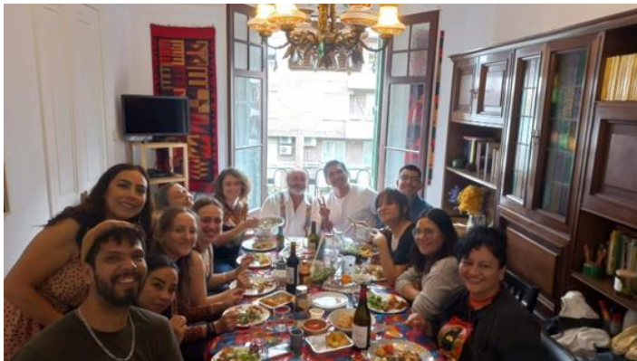
Dinar de les periodistes acollides amb l'equip tècnic i d'acompanyament del Programa Barcelona Protegeix Periodistes de Mèxic