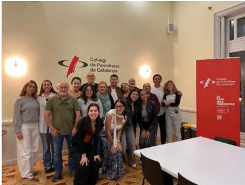
Reunió amb el Grup de Treball en Periodisme Solidari del Col·legi de Periodistes