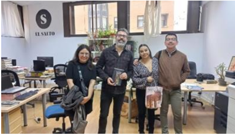
Visita a la redacció del diari El Salto.