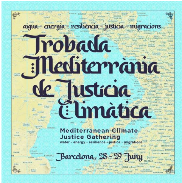
Trobadà Mediterrània de Justícia Climàtica