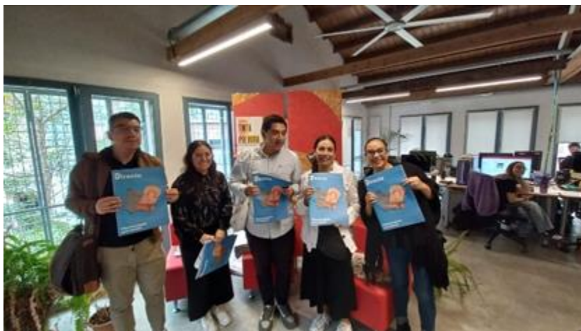
Visita a la redacció del diari La Directa