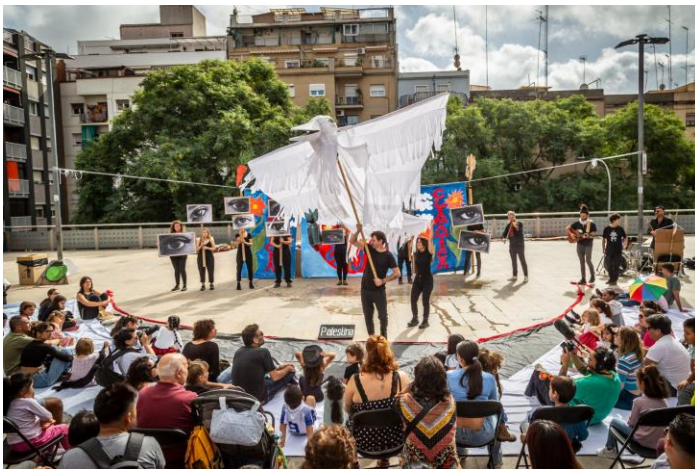
Circ Popular de la Justícia Climàtica