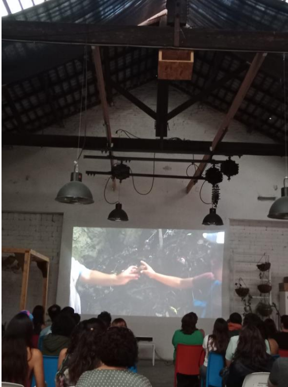
Gran Festa Cos Territoris 2024